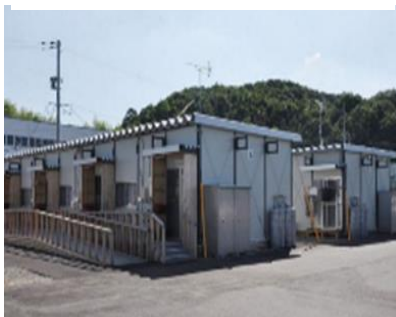
仮設住宅(借上げ型)